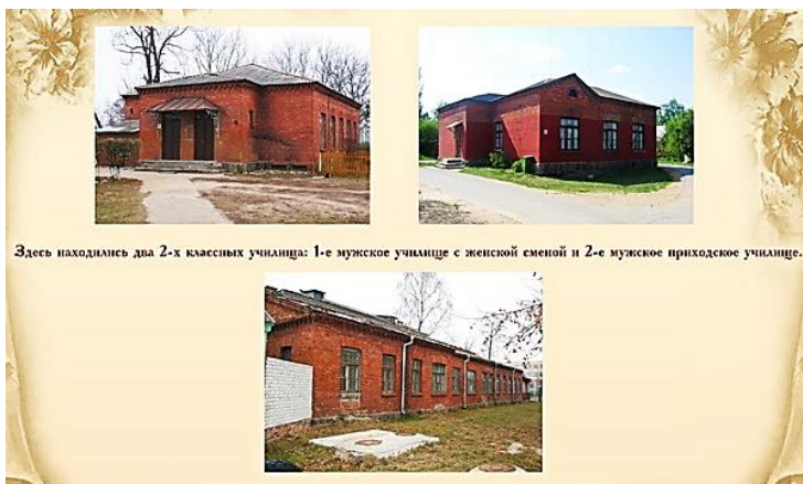
Здесь находились два 2-х классных училища: 1-е мужское училище с женской сменой и 2-е мужское приходское училище.

У 1911 годзе адкрываецца другое 2-класнае мужчынскае вучылішча ў асобным каменным флігелі, пабудаваным у 1897 годзе за кошт казны. У першым вучылішчы займаліся 99 хлопчыкаў, у другім – 85.