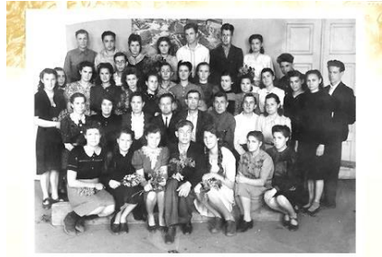
Выпуск 1948 года составил 24 человека