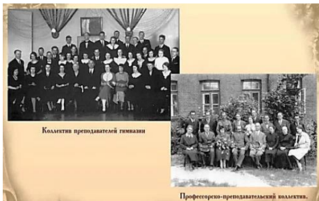
Калектыв преедватаскі гімназіі