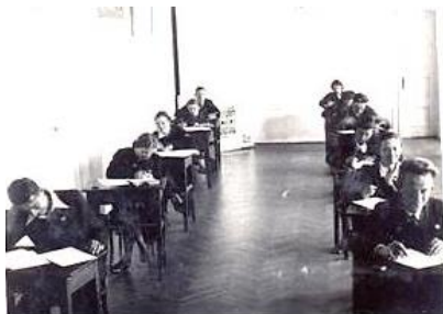
На экзамене в лицее, 1938 г.

Пры гімназіі імя М. Радзевіч працаваў агульна-адукацыйны ліцэй, у якім навучанне доўжылася два гады. Вучоба ў ліцэі, як і ў